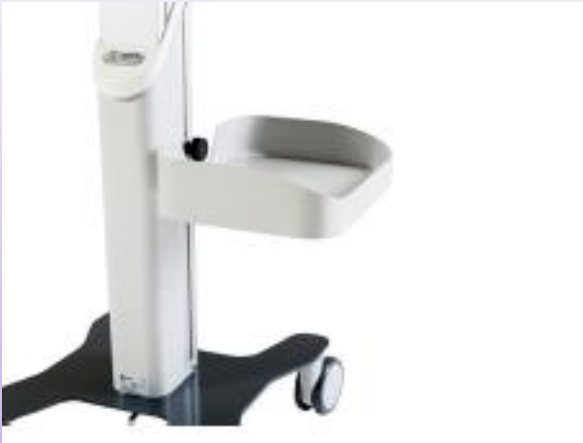
BOÎTE D' ACCESSOIRES A4