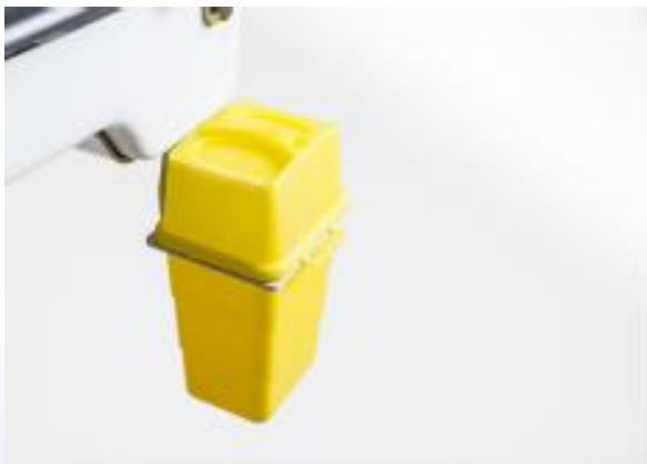
SUPPORT POUR CONTENEUR POUR OBJETS TRANCHANTS