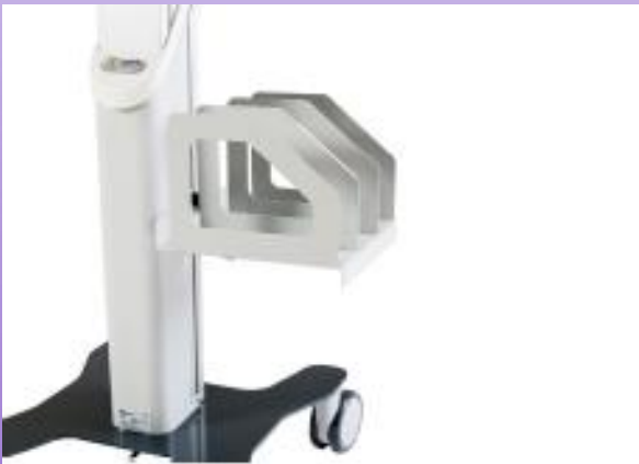
SUPPORT POUR DOSSIERS PATIENTS