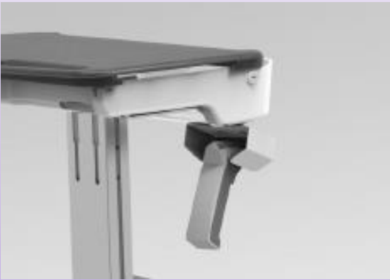
SUPPORT POUR LECTEUR DE CODE-BARRES