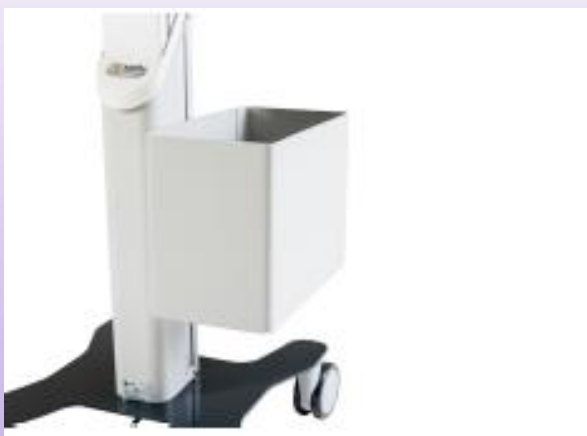
SUPPORT POUR DOSSIERS SUSPENDUS