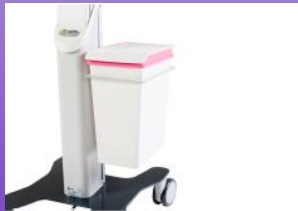
POUBELLE EN PLASTIQUE