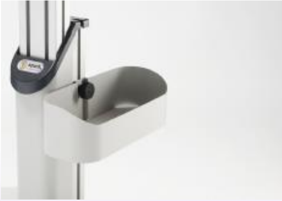
BOÎTE D' ACCESSOIRES PETITE