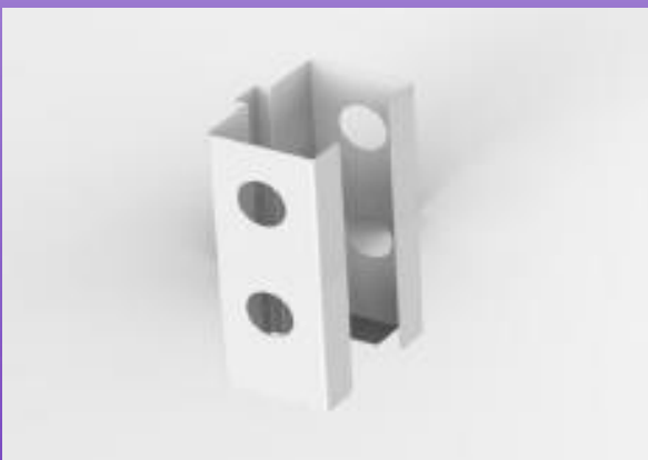
SUPPORT POUR DISTRIBUTEUR DE GANTS