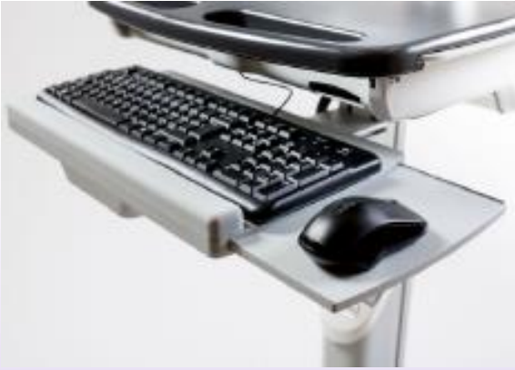
TIROIR À CLAVIER