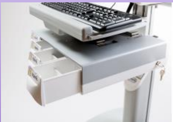
CASSETTE POUR TIROIRS À MÉDICAMENTS